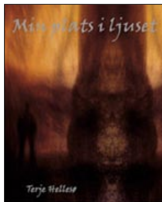
Gåvobok - Min plats i ljuset .