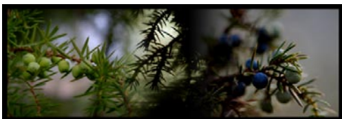
Bild som sitter ovanför ett konferensrum på ett större företag i Söderhamn. Bilden representerar både namnet och storleken på konferenslokalen, som är den minsta av tre. Bildens yttermått är: H 50cm B 146cm.

Köper man 30 eller fler böcker så kostar boken 400 kr. Vår hemsida innehåller idag cirka 3000 bilder och de kan fås som fineprints signerade av fotografen och inramade med passepartout och glas för 3900 kr.