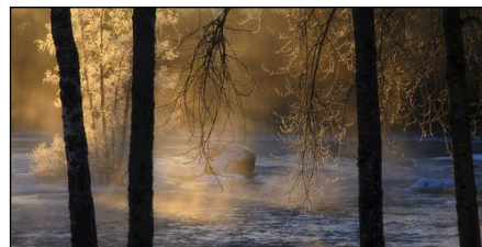
Bild från Gysinge, Gästrikland, bilden ingår i Terjes projekt Dagens bilder.