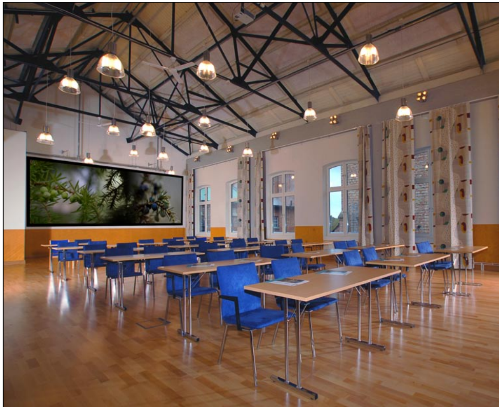
Här ser vi en bild från ett stort konferensrum. Så här kan det se ut med en fin bild som täcker ut en stor vägg. (Bilden är ett montage)