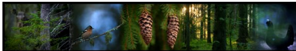
Här ser vi ännu en bild från ett större konferensrum. Bilderna har gjorts så att inga skarvar syns, bilderna flyter ihop med varandra. Bildens yttermått är: H 50cm B 290cm

Fler och fler företag använder sig av fotografisk konst för att utsmycka sina lokaler. Det är ett lätt och prisvärt sätt att förhöja arbetsglädjen på ditt företag! Efter överenskommelse gör vi en layout efter era önskemål och lämnar sedan över den för godkännande, varefter vi monterar och sätter upp bilderna på plats, enklare kan det inte bli. Har vi inte bilderna ni vill ha så gör vi dem. Vi har ett brett sortiment av fotoutrustning och kunnande, allt för att säkerställa att vår kund blir entusiastisk av att se våra bilder.